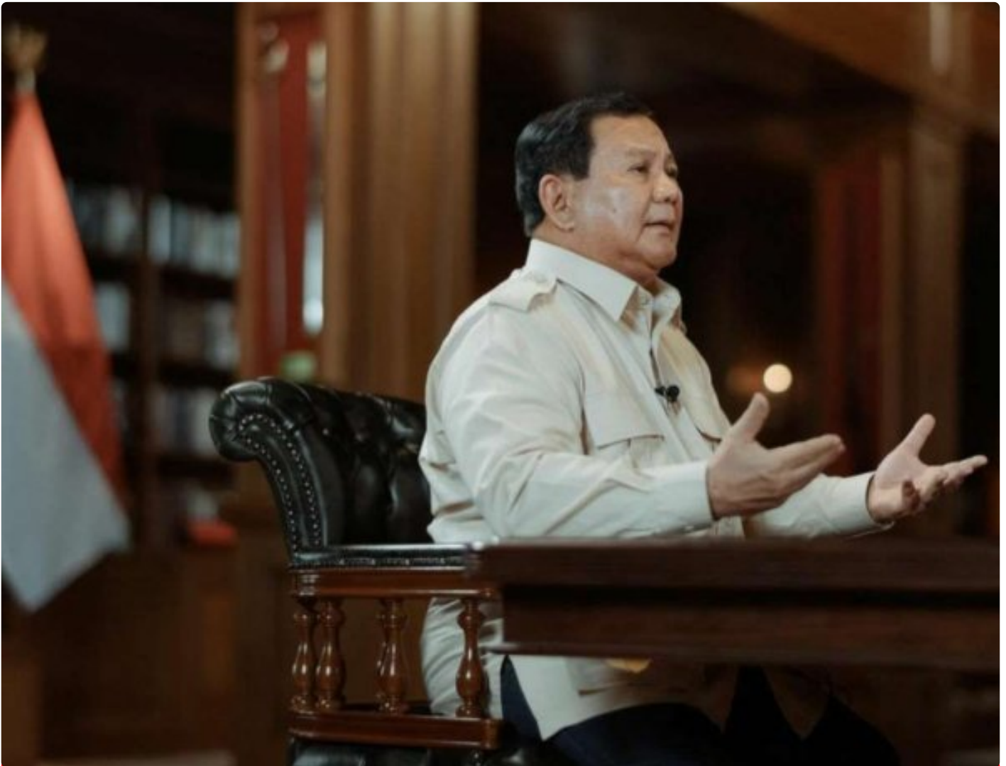
Prabowo Subianto Presiden RI 2024-2029

PENDIDIKAN - Indonesia dikenal sebagai negara yang kaya akan sumber daya alam. Dari hasil tambang yang berlimpah, laut yang luas dengan kekayaan hayati yang melimpah, hutan yang menjadi paru-paru dunia, hingga sumber daya energi yang tersebar di berbagai wilayah, semuanya menjadi kekuatan besar bagi bangsa ini. Potensi besar tersebut seharusnya dapat dimanfaatkan untuk